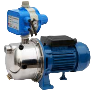
GP - JETINOX/AQUACONTROL-MC