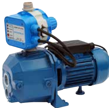
GP - DJ/AQUACONTROL-MC