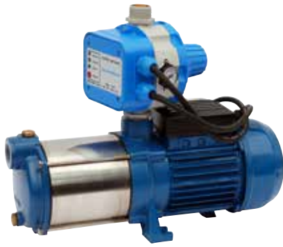
GP - BM/AQUACONTROL-MC