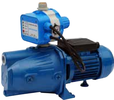
GP - JET/AQUACONTROL-MC

Groupes de pression appropriés pour demeures domestiques et irrigation par aspersion.