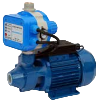
GP - PE/AQUACONTROL-MC