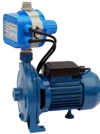
GP - CM/AQUACONTROL-MC